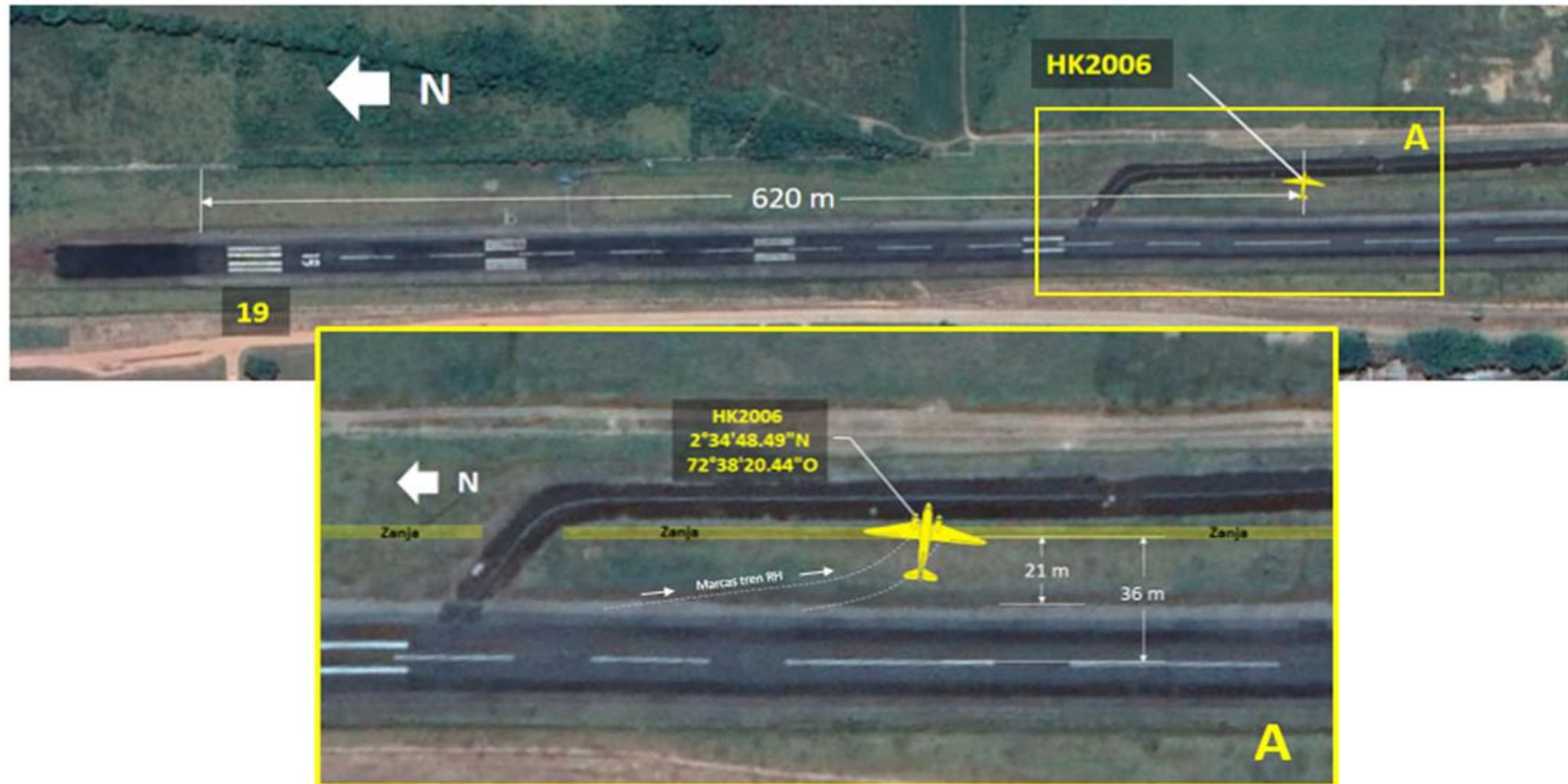
Grafica No. 1: Diagrama del evento