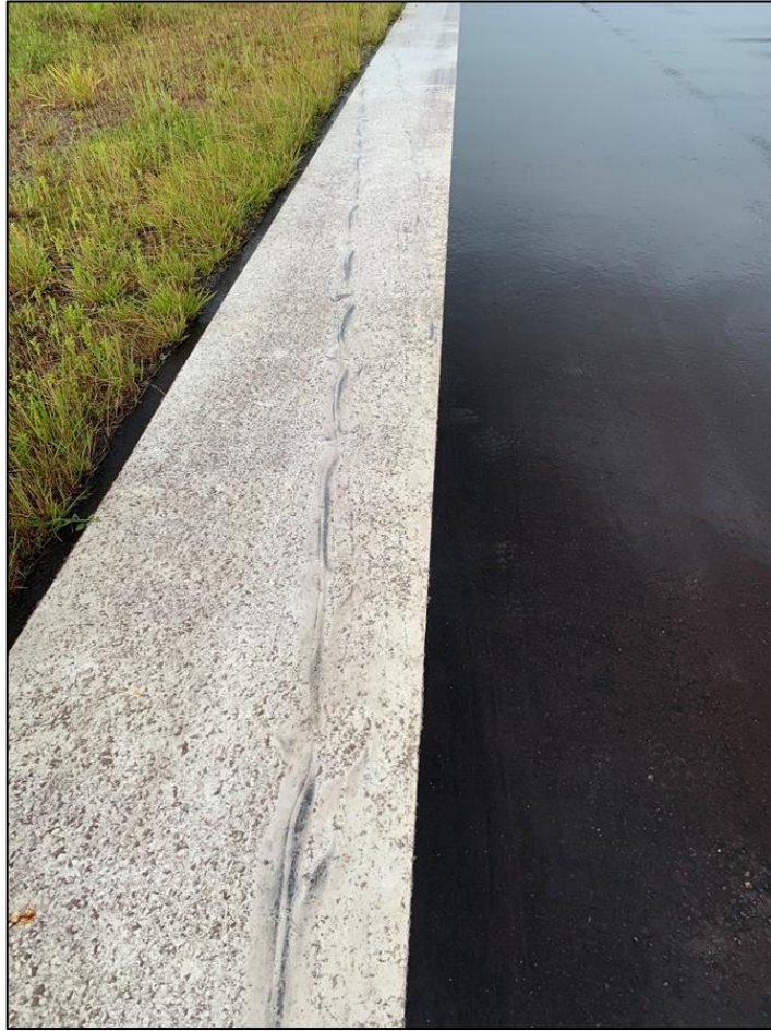
Fotografía No. 5: Marca de la llanta izquierda, desinflada, dejando la pista.