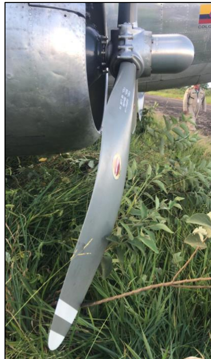
Fotografía No. 2: Daños en la hélice de cada motor.