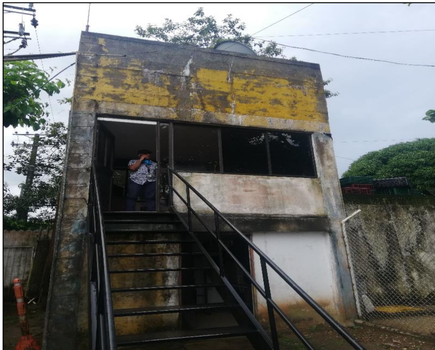
Fotografía No. 6: Estado de las Instalaciones del SEI del aeropuerto San José del Guaviare