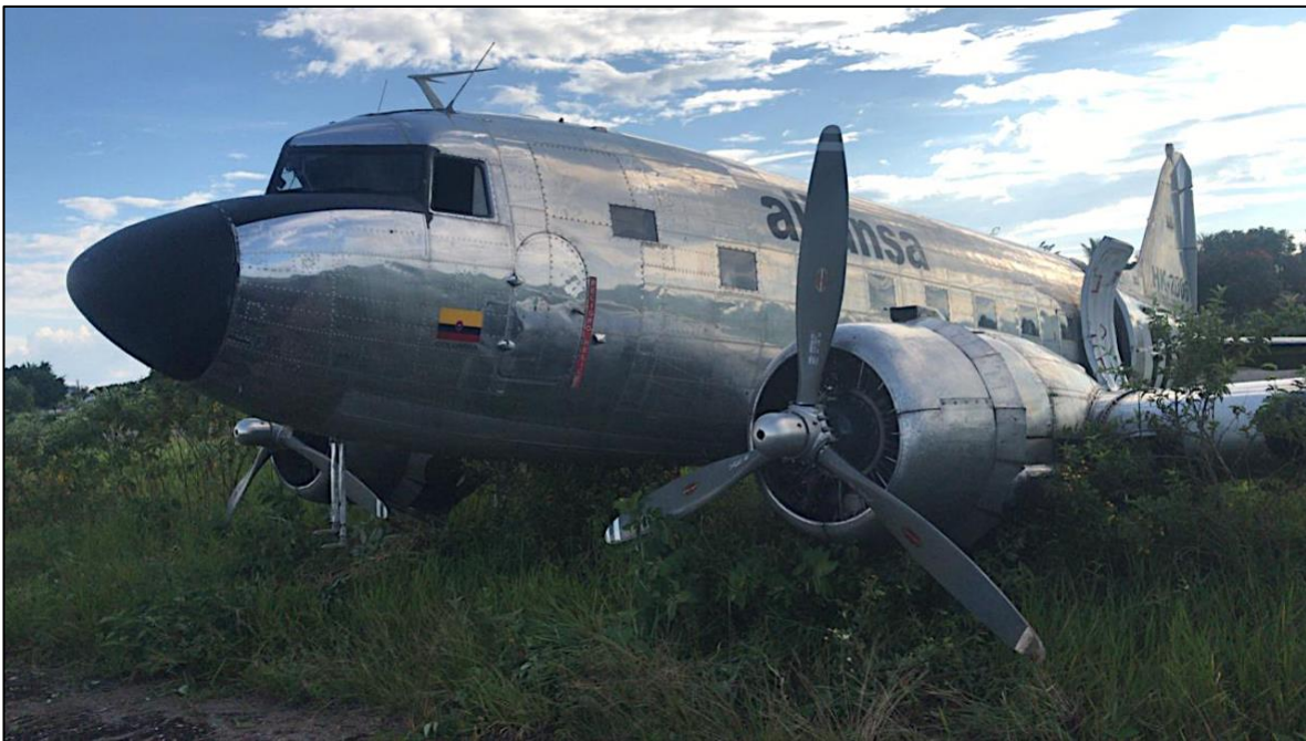
Fotografía No. 1: Posición final del HK2006.

La investigación emitió cinco (5) a la Unidad Administrativa Especial de Aeronáutica Civil.