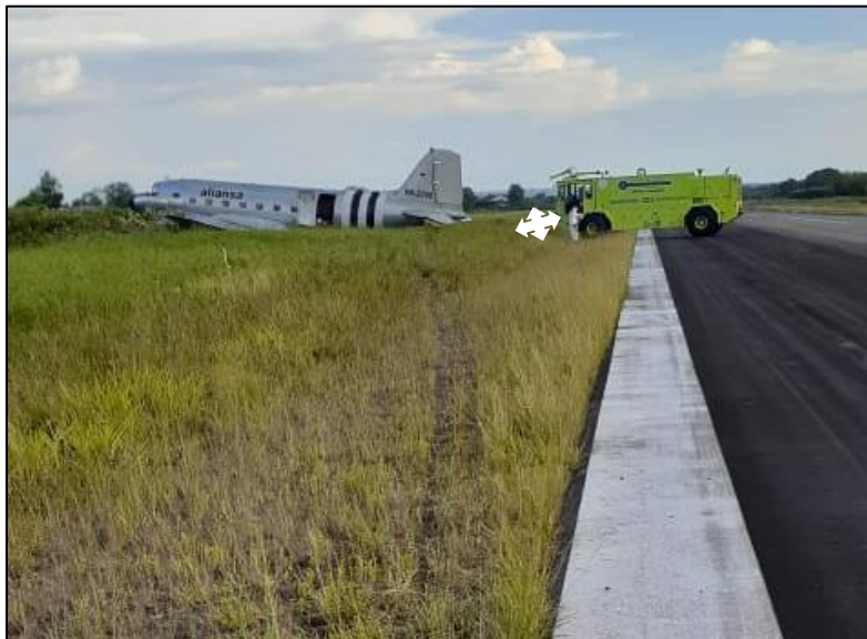
Fotografía No. 4: Posición de la aeronave con respecto al umbral de la pista 19.

Los daños en las hélices (abrasión), fueron producto de su contacto con el desnivel de la zona de seguridad creado por la zanja en la cual terminó la aeronave.