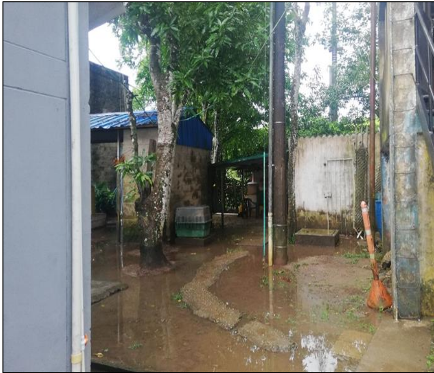
Fotografía No. 7: Estado de las Instalaciones del SEI del aeropuerto San José del Guaviare